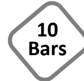
Tableau des dimensions et poids